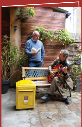
Les auteurs nantais